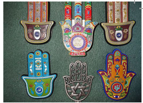
»Hand der Fatima«

Der politische Islam hat sich zu einer bedeutenden Ideologie im Nahen Osten und in Nordafrika entwickelt. Islamistische Kräfte haben die Massen gegen autoritäre Regime mobilisiert und sich an den Umbrüchen des Arabischen Frühlings beteiligt. Nach den Regimestürzen von 2011 regierten islamistische Akteure beispielsweise in Tunesien, Libyen und Marokko. Gleichzeitig nutzen unterschiedliche Lager den politischen Islam zur Legitimierung ihres Handelns.